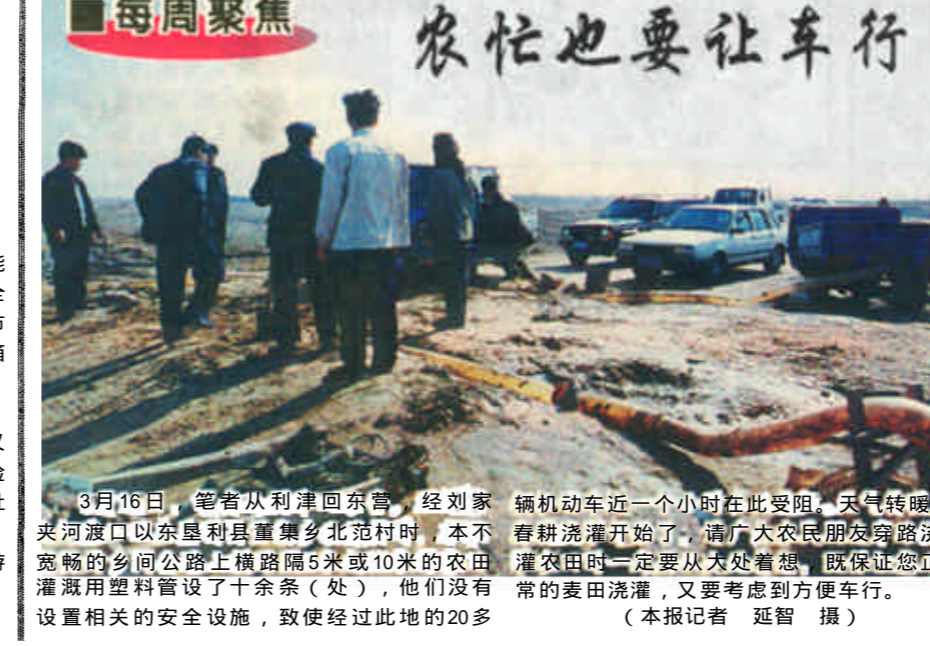
3月16日，笔者从利津回东营，经刘家夹河渡口以东垦利县董集乡北范村时，本不宽敞的乡间公路上横路隔5米或10米的农田灌溉用塑料管了十余条(处)，他们没有设置相关的安全设施，致使经过此地的20多辆机动车近一个小时在此受阻。天气回暖，春耕浇灌开始了。请广大农民朋友穿路浇灌农田时一定要从大处着想，既保证您正常的麦田浇灌，又要考虑到方便车行。(本报记者 延智 摄)

目前，在我市的大街小巷，尤其是居民小区内，一支支捡破烂“游击队”流动频繁。他们的出现，提高了废物的使用价值，但也给美丽的东营造成不少麻烦。这些捡破烂的人，既有外地来的人员，又有本地人员，一般衣衫褴褛、蓬头垢面，与文明整洁的市容氛围形成了强烈反差。他们或骑自行车，或拉着地排车，或手提编织袋，穿梭于市区繁华街道和居民小区，大摇大摆，横冲直撞，如入无人之境，许多小区居民见他们过